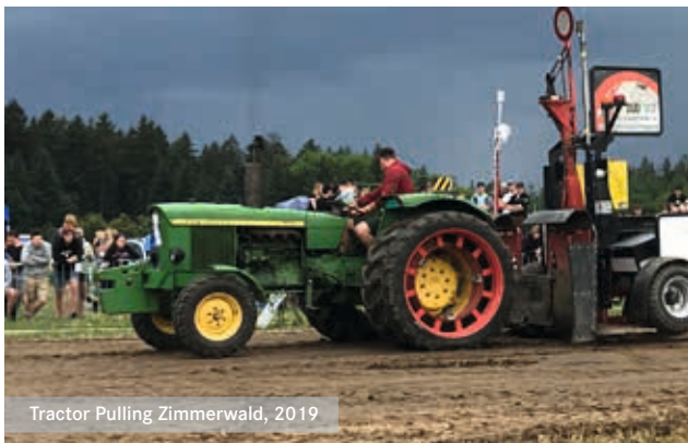
Tractor Pulling Zimmerwald, 2019