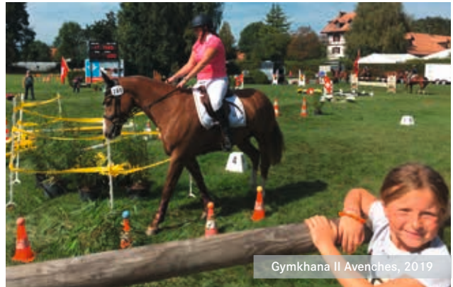
Gymkhana II Avenches, 2019