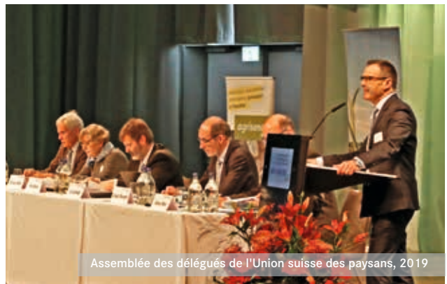
Assemblée des délégués de l'Union suisse des paysans, 2019