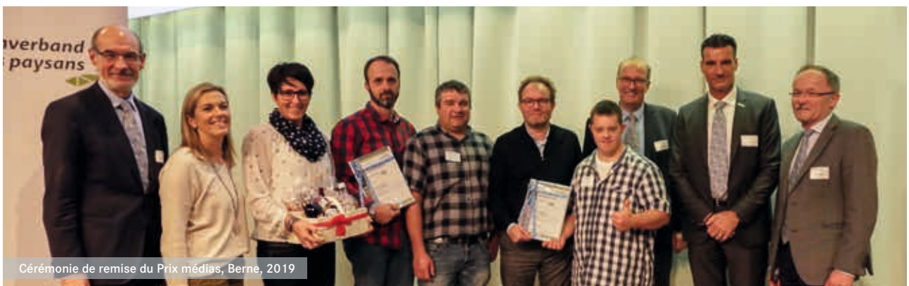
Cérémonie de remise du Prix médias, Berne, 2019