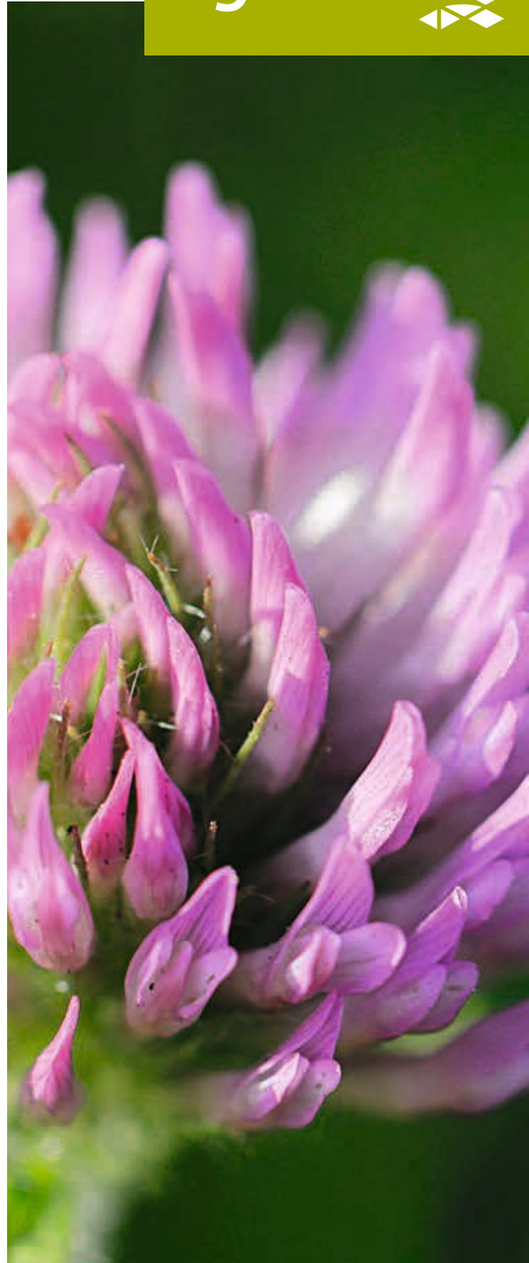
Fleur de trèfle | © Agrisano