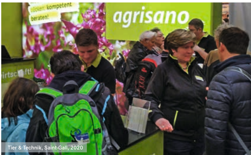
Tier & Technik, Saint-Gall, 2020