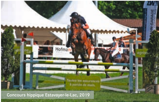
Concours hippique Estavayer-le-Lac, 2019