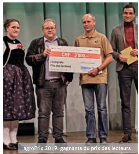
agroPrix 2019, gagnants du prix des lecteurs